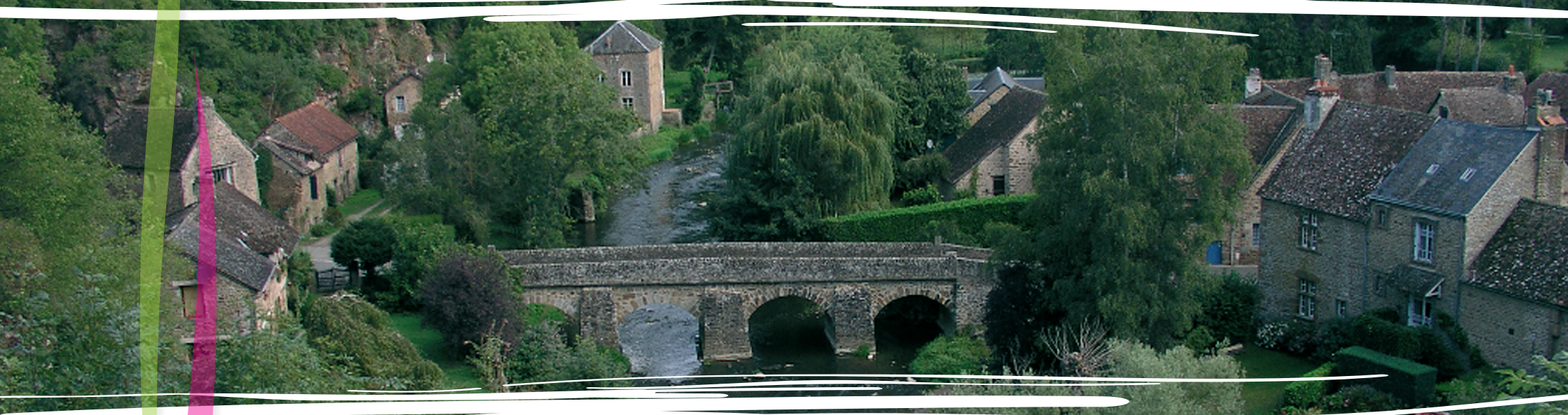
Schéma d'Aménagement et de Gestion des Eaux du bassin versant de la SARTHE AMONT