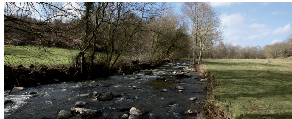
Le Sarthon à Saint-Pierre-des-Nids (53)

Et un dernier objectif de moyens traduit au sein de l' Objectif spécifique n°5 : Partager et appliquer le SAGE.